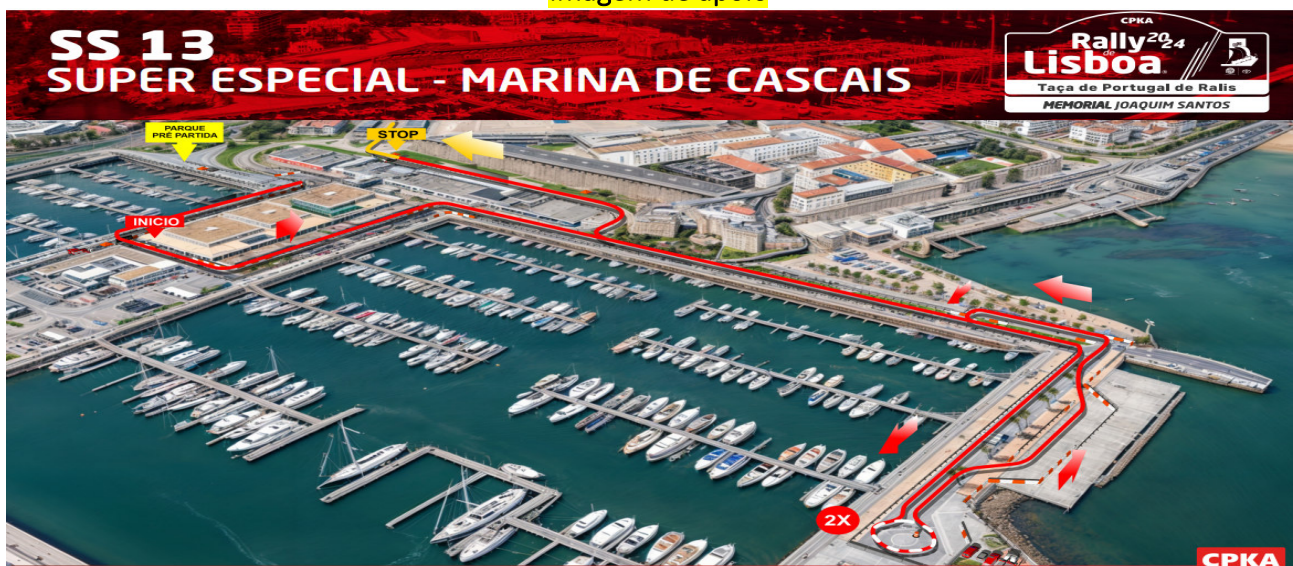
Imagem de apoio