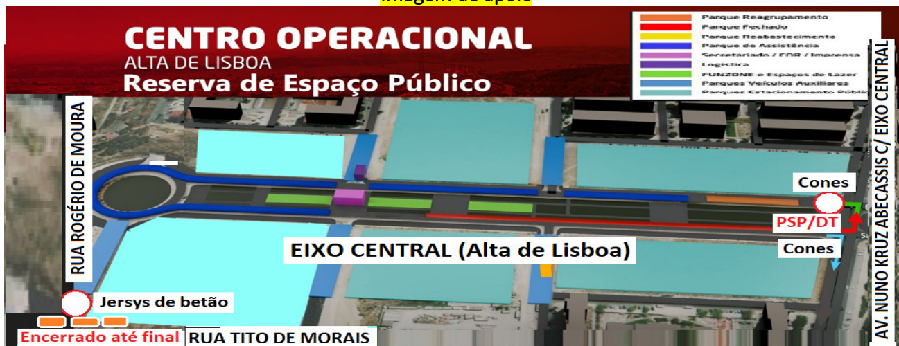
Imagem de apoio

Operacional da Prova, pelo que às 08H00 de 31MAI2024 é encerrado o Eixo Central da Alta de Lisboa (entre a Av. Nuno Krus Abecassis e a Rotunda com a Rua Rogério Moura C/ Rua Tito Morais), para as montagens da logística de pódios de saída e saída dos carros, bem como posto comando de toda a operação na grande Lisboa. A abertura deste local é às 20h00 do dia 09JUN2024 (ver imagem e apoio).