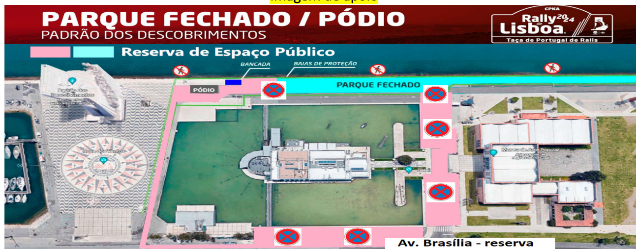
Imagem de apoio